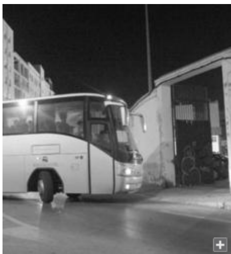
El autobús con los niños, llegando anoche a Cádiz.