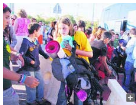
Los jóvenes scouts desalojados al regresar a Sevilla, en la parada de Puerta Triana.