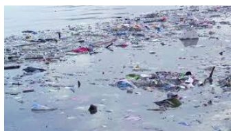
“Plástico por todas partes”