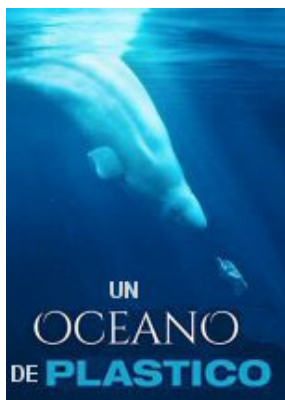
“Océanos de Plástico”